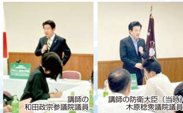
講師の 和田政宗参議院議員