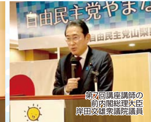
第7回講座講師の前内閣総理大臣 岸田文雄衆議院議員