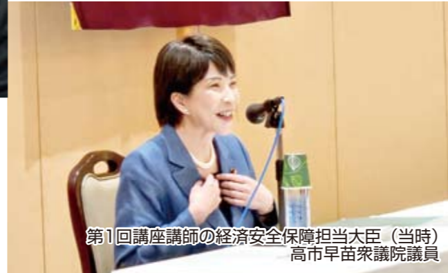
第1回講座講師の経済安全保障担当大臣(当時) 高市早苗衆議院議員