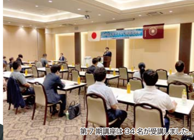
第7期講座は34名が受講しました。

ジットプラザ ※諸事情により変更する場合があります。 〒400-0042 山梨県甲府市高畑2丁目19-2 3F