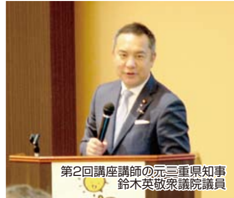
第2回講座講師の元三重県知事 鈴木英敬衆議院議員