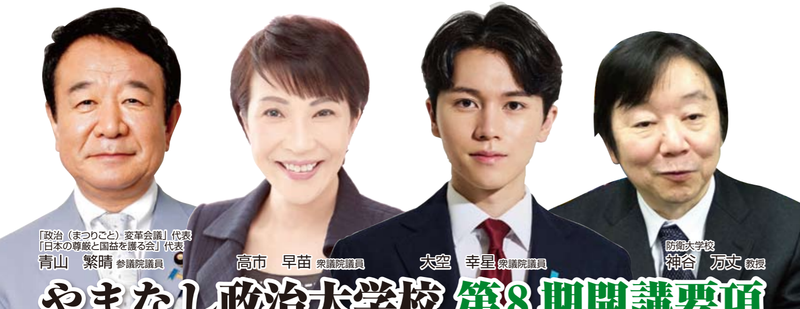
「政治（まつりごと）変革会議」代表 「日本の尊厳と国益を護る会」代表 青山 繁晴 参議院議員