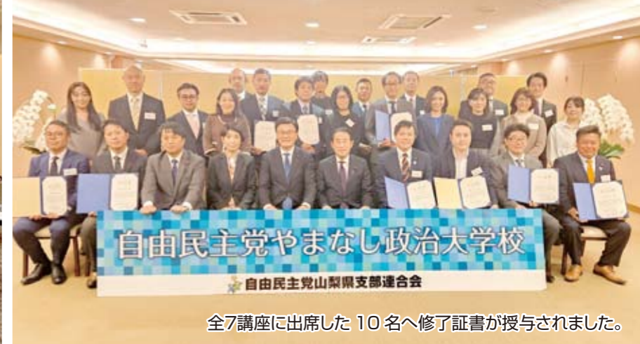
全7講座に出席した10名へ修了証が授与されました。