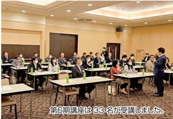
第6期講座は33名が受講しました。