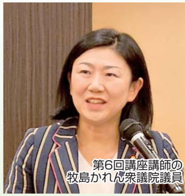
第6回講座講師の 牧島かれん衆議院議員