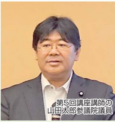
第5回講座講師の 山田太郎参議院議員