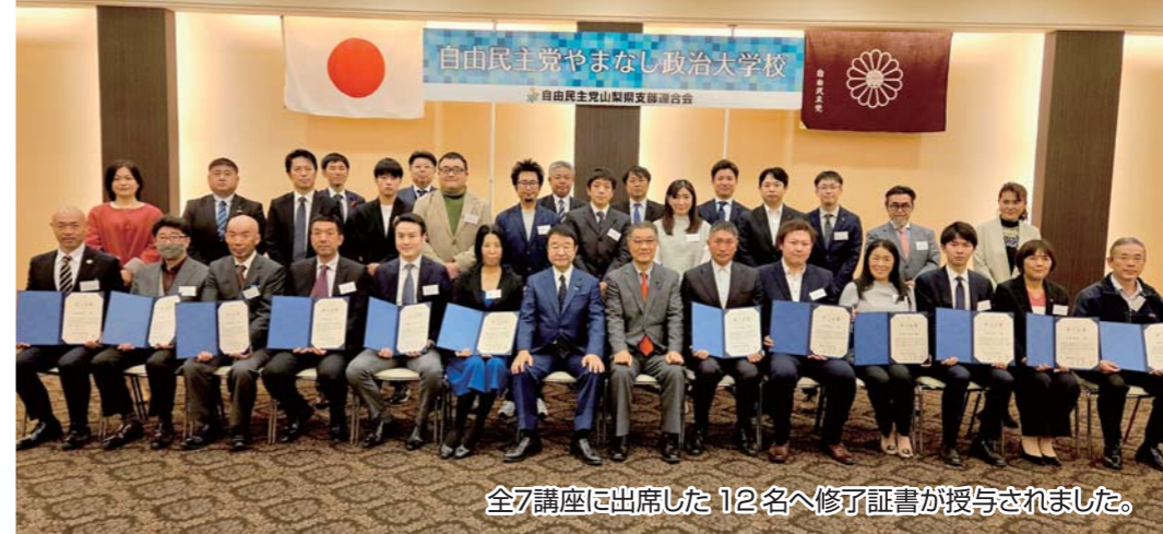
全7講座に出席した12名へ修了証書が授与されました。

会場 ジットプラザ ※諸事情により変更する場合があります。 〒400-0042 山梨県甲府市高畑2丁目19-2 3F