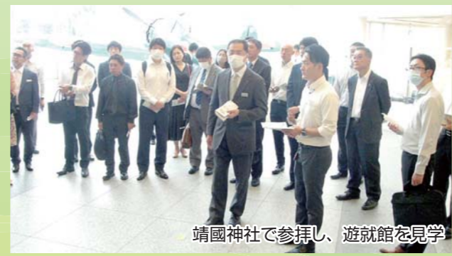
靖国神社で参拝し、遊就館を見学