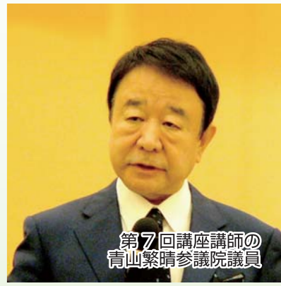
第7回講座講師の 青山繁晴参議院議員