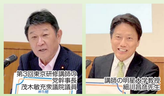
第3回東京研修講師の 党幹事長 茂木敏充衆議院議員