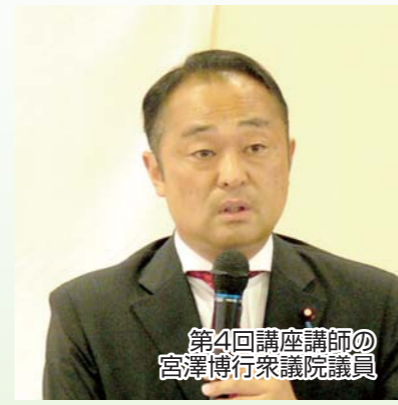
第4回講座講師の 宮澤博行衆議院議員