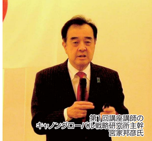
第1回講座講師の キャンングローバル戦略研究所主幹 宮家邦彦氏